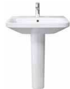
# 231965 # 085829