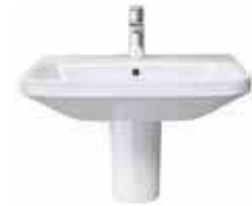
# 231965 # 085830