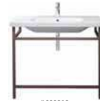
# 232010 # DS 9893