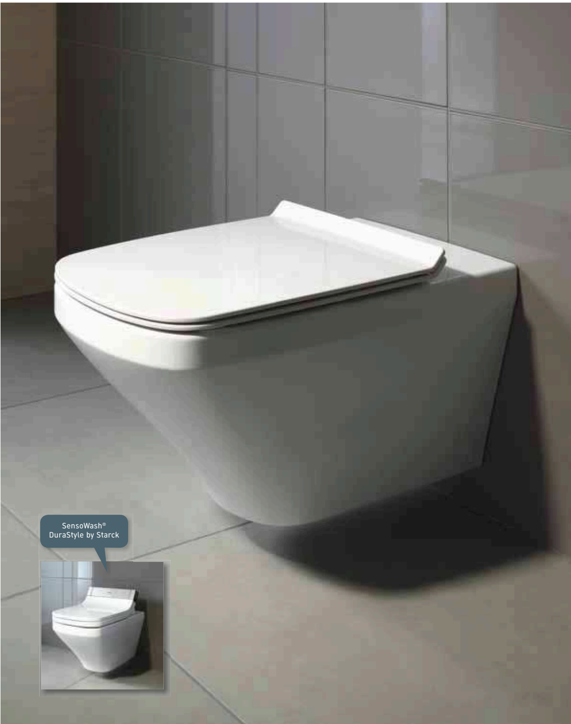
SensoWash® DuraStyle by Starck