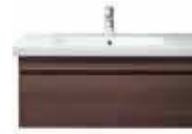
# 232010 # DS 6382