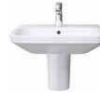
# 231960 # 085830