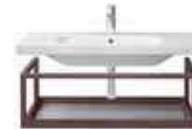
# 232010 # DS 9873