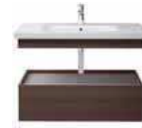
# 232010 # DS 6082 # DS 6282