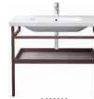
# 232010 # DS 9883