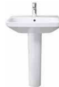
# 231960 # 085829