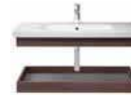
# 232010 # DS 6082 # DS 6182