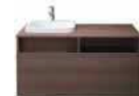
# 037243 # DS 6784 L/R