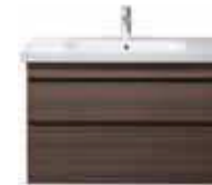
# 232010 # DS 6482