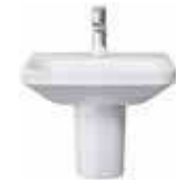
# 070845 # 085831