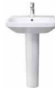
# 231955 # 085829