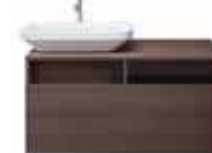
# 034960 / # 034943 # DS 6784 L/R